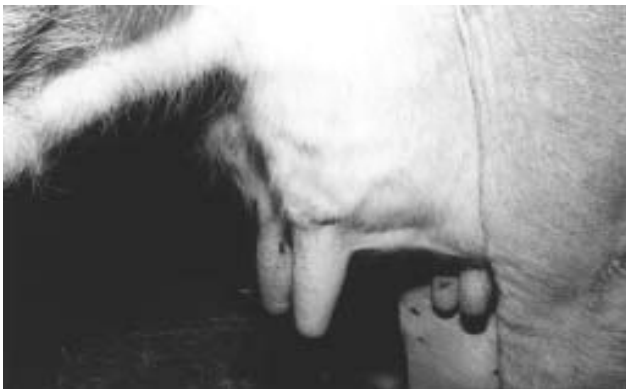
Source de santé?

«Des études sur la nutrition, menées dans de nombreux pays, mais également par nous, ont montré que les végétaliens sont généralement en meilleure santé que les autres. Leurs valeurs concernant le poids, la pression artérielle, le taux de graisse