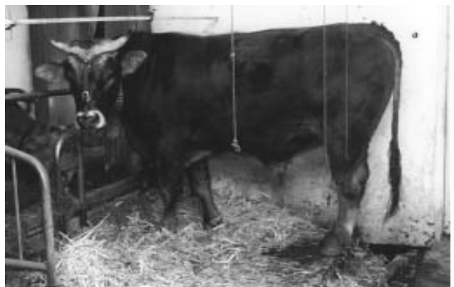
Du fait de l'utilisation généralisée de l'insémination artificielle, le taureau est devenu une espèce rare!

Pour les humains, la situation est tout autre. Le bébé est porté durant longtemps par la mère. Il n'a donc pas besoin d'un squelette qui se fortifie rapidement (donc une absorption massive de calcium n'est pas nécessaire). Par contre son développement se concentre sur le cerveau. C'est pourquoi le lait de femme contient deux fois plus de