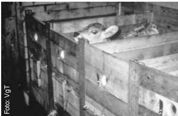
Les veaux sont séparés de leur mère et enfermés dans des boxes isolés.

Après quelques années, la production de lait diminue fortement chez la vache qui n'est plus rentable. Elle est alors envoyée à l'abattoir.